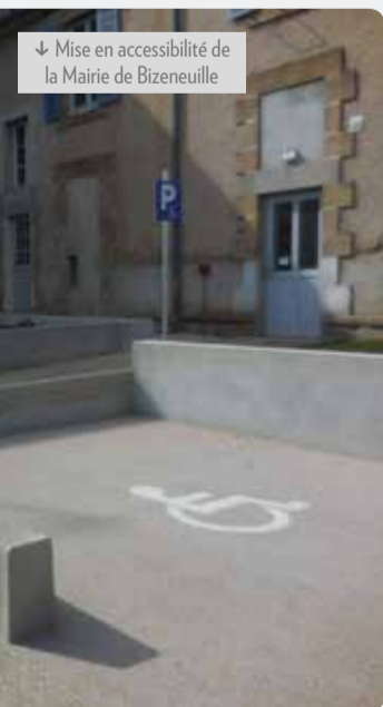
↓ Mise en accessibilité de la Mairie de Bizeneuille

Se renseigner: Cécile Dumont au 07 84 68 32 97 ou par mail: portagederepas@orange.fr