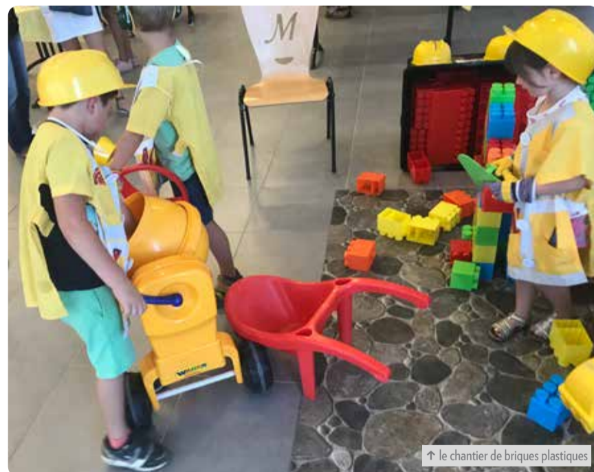
↑ le chantier de briques plastiques

L'organisation avait su réunir tous les acteurs du jeu dans le département: les associations montluçonnaises de jeux et le café jeux « Un pion, c'est tout », la ludothèque