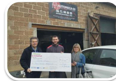
Automeca 03 Doyet