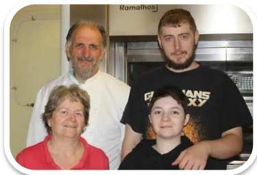
La Maison Sulli Doyet