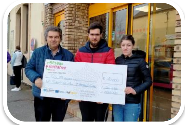
Boulangerie Nigon Commentry

Ils ont été accompagnés et financés par Initiative Allier