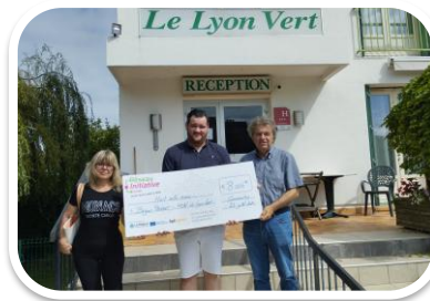
Le Lyon Vert Commentry