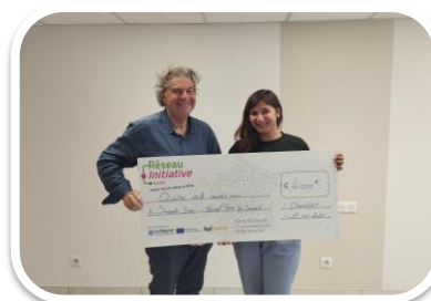
Salon de Coiffure Chamblet