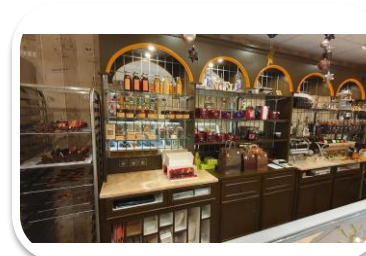
Les Délices de Cali Montmarault