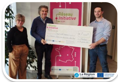
Agri Prox Bézenet