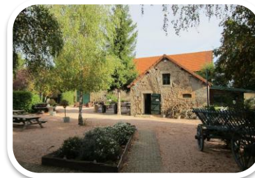
Camping La Petite Valette Sazeret